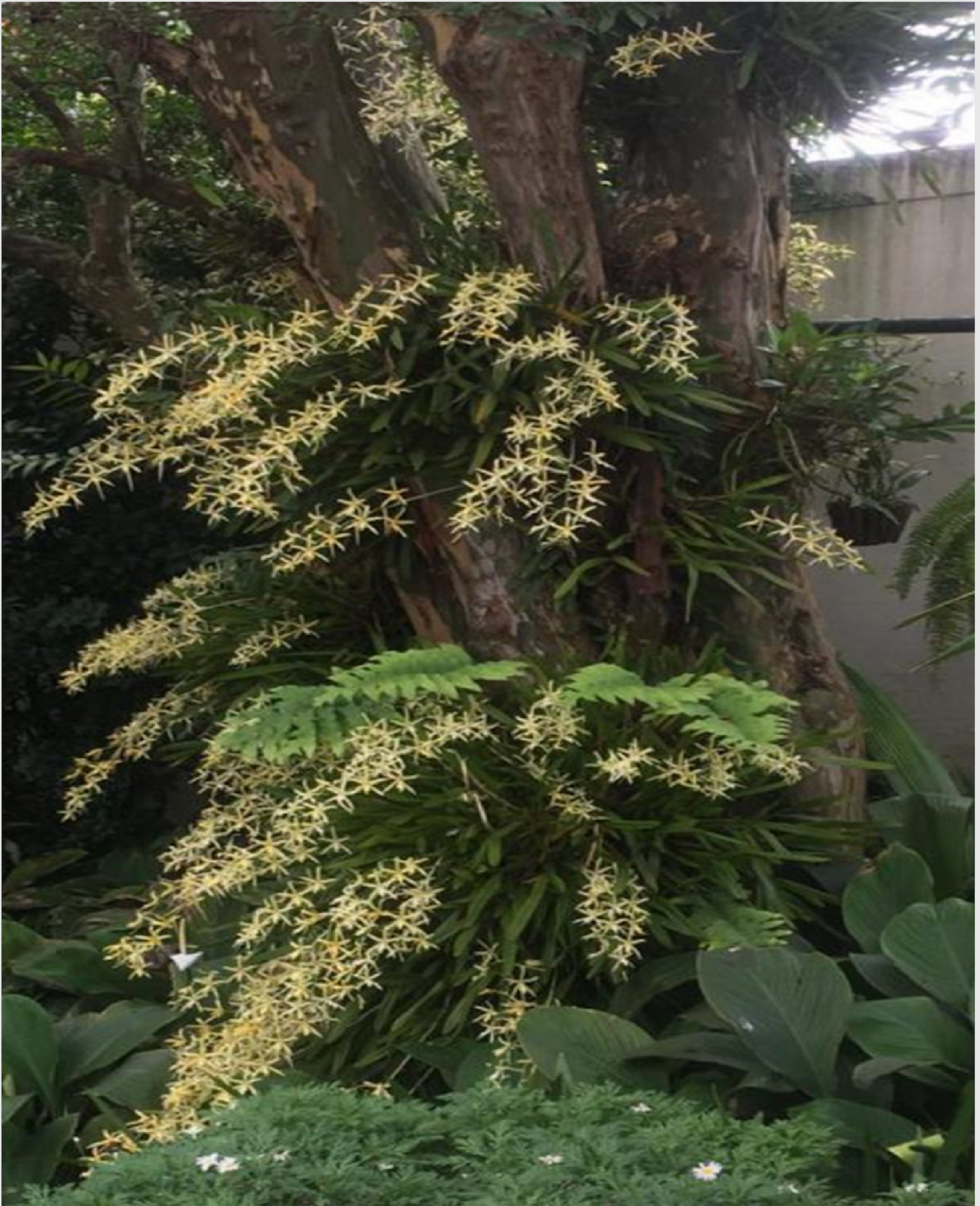
As orquideas ( Miltonia flavescens ) carregadas enfeitam o tronco da árvore.