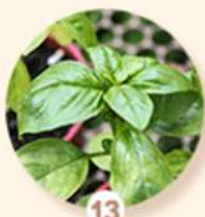
13 Manjeriçao de folha larga