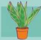
Espada de São Jorge