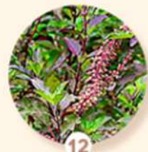
12 Manjeriçao Sagrado