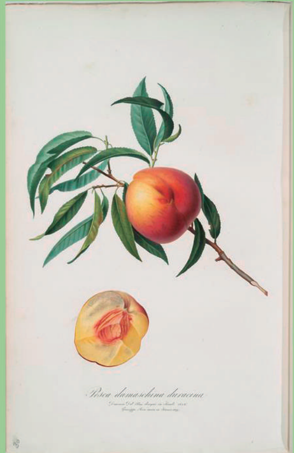
Pesca Damnaschina duracina. [ Persica julodermis ; Peach]