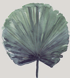
PALMEIRA-LEQUE ( Licuala grandis )