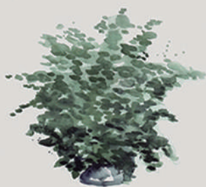
AVENCA ( Adiantum species )