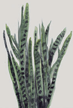
ESPADA-DE-SÃO-JORGE ( Sansevieria zeylanica )