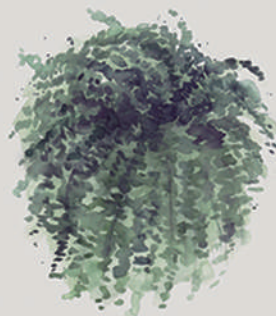
SAMAMBAIA ( Asplenium nidus )