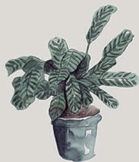
MARANTA ( Calathea orbifolia )