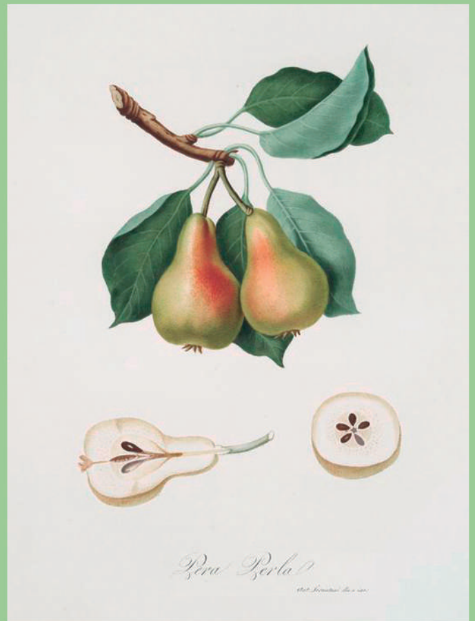
Pera Perla. [Pyrus Perla ; Pear]