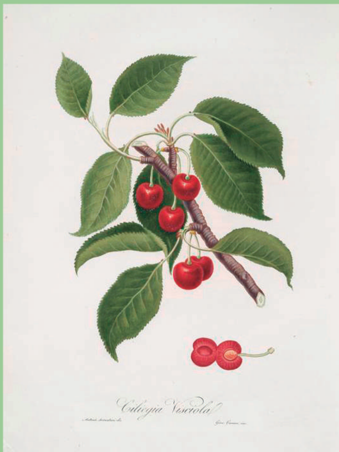
Ciliegia visciola. [Cerasus visciola ; Sour cherry]