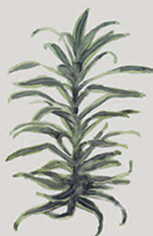
PLEOMELE ( Chromolaena odorata )