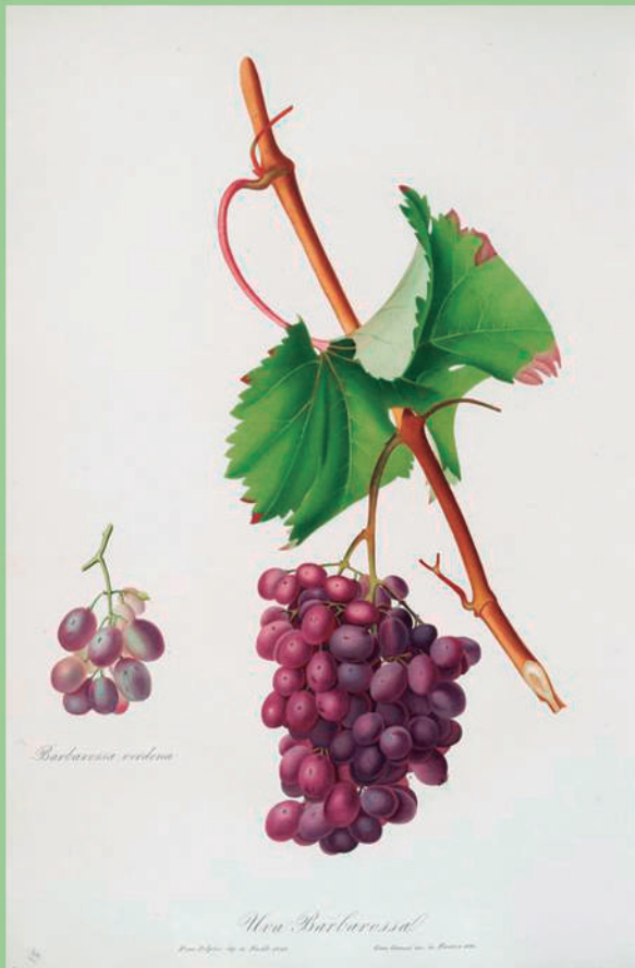
Uva Barbarossa. [ Vitis vinifera ; Grape Barberossa]

Enfeitar as paredes com prints botânicas traz uma dose de charme, que é quase irresistível. Criadas entre os anos 1817 e 1839, as ilustrações do italiano Giorgio Gallesio, por séculos, serviram de referência para cientistas interessados nas frutas cultivadas no sul da Itália.