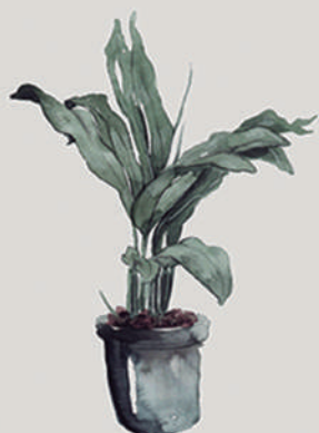
CICLANTO ( Cyrtanthus portifolius )