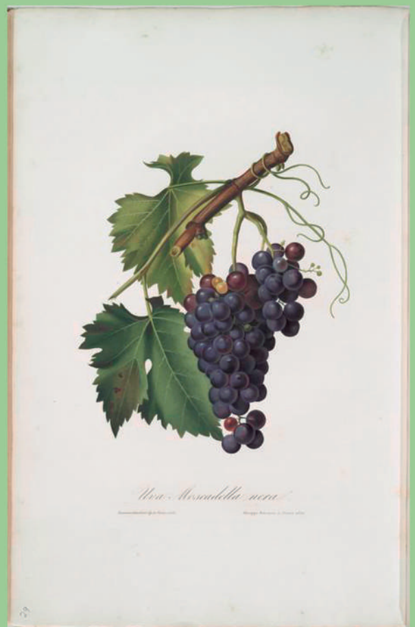
Uva moscadella nera. [Moscadella black grapes]