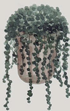
COLAR-DE-PÉROLAS ( Senecio maculipennis )