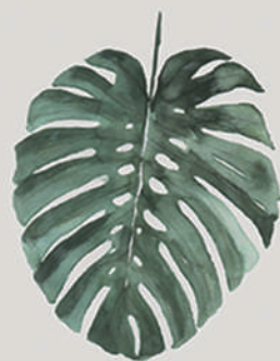
COSTELA-DE-ADÃO ( Monstera adansonii )