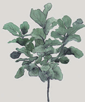
FIGUEIRA-LIRA ( Ficus lyrata )