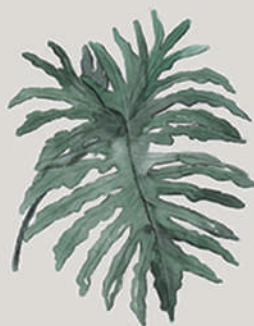
GUAIMBÉ ( Philodendron bipinnatifidum )