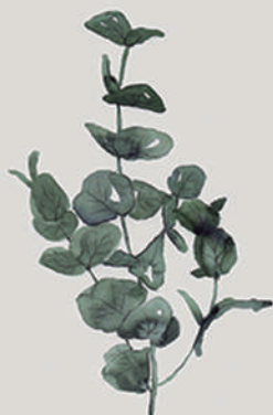
EUCALIPTO ( Eucalyptus citriodora )