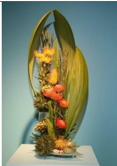
Design Criativo Maciço