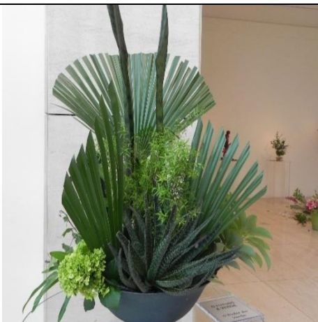
Design Folhagens Verdes