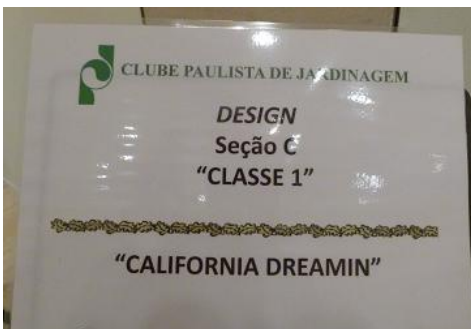
Mesa de Exibição Tipo I