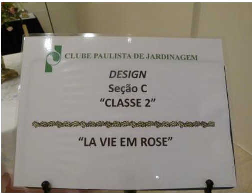
Mesa Funcional Semiformal