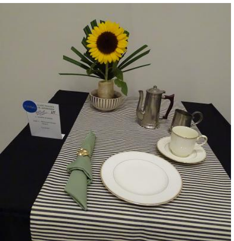
Mesa Cápsula Funcional