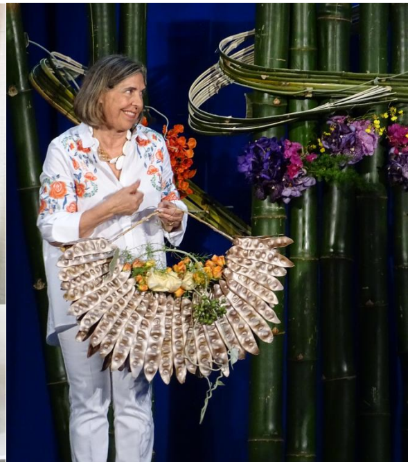
DEMONSTRAÇÃO M. FRANÇOISE