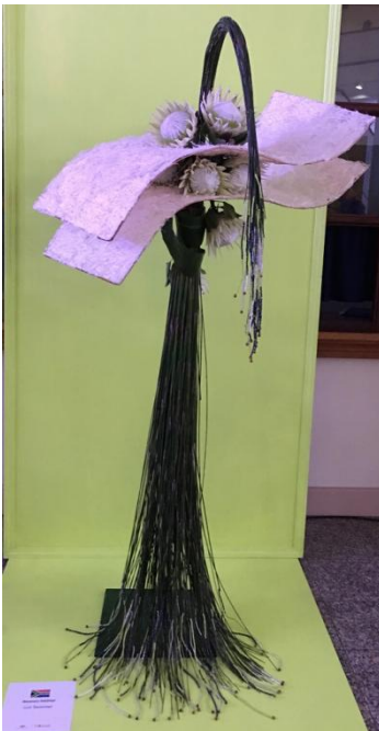
ÁFRICA DO SUL